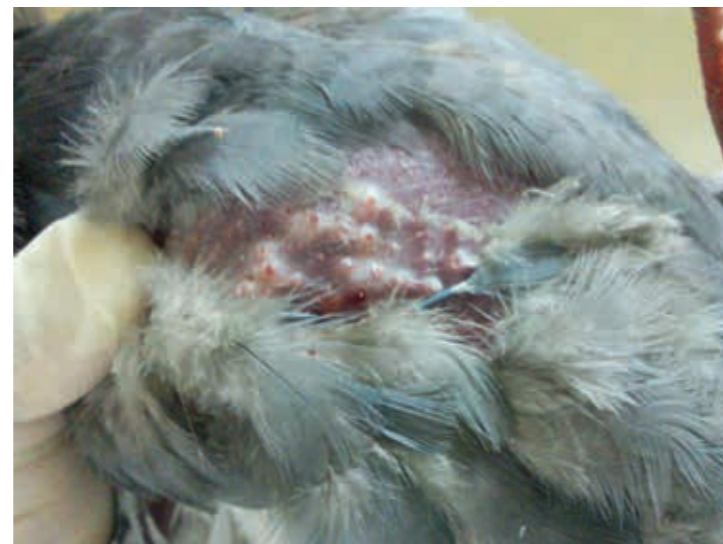
Рис. 2. Проллиферативно-некротические поражения кожи у голубя в области нанесения в оголенные перьевые фолликулы груди изолята «Pigeon/Rus-Astrakhan/PGPV/2012» вируса оспы голубей на 17 сутки после заражения