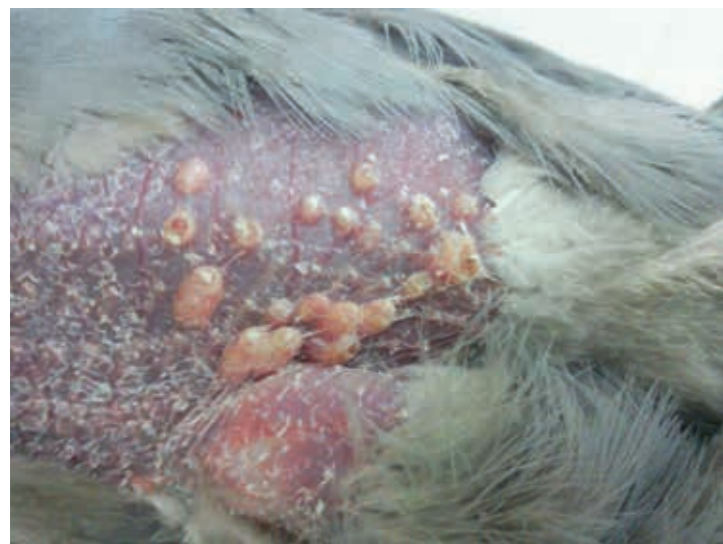
Рис. 1. Проллиферативно-некротические поражения кожи у голубя в области нанесения в оголенные перьевые фолликулы груди изолята «Pigeon/Rus-Vladimir/PGPV/2010» вируса оспы голубей на 20 сутки после заражения

В группе голубей, инфицированных накожно и внутрикожно изолятом «Pigeon/Rus-Astrakhan/PGPV/2012» вируса оспы голубей, у 6 из 7 птиц обнаружили отчетливые поражения перьевых фолликулов в области груди