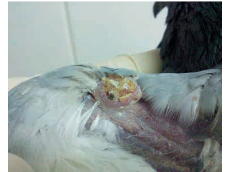
Рис. 4. Проллиферативно-некротические поражения кожи перепонки крыла у голубя в области интрадермальной инъекции изолята «Pigeon/Rus-Astrakhan/PGPV/2012» вируса оспы голубей на 20 сутки после заражения

с вовлечением в инфекционный процесс окружающей их кожи в виде покраснения и опухания (рис. 2). На 20 сутки после заражения пораженные перьевые фолликулы покрылись небольшими корочками коричневого цвета (рис. 3). На рис. 4 представлены пролиферативно-некротические поражения кожи перепонки крыла у голубя в области интрадермальной инъекции на 20 сутки после заражения изолятом «Pigeon/Rus-Astrakhan/PGPV/2012».